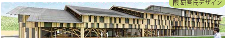
隈研吾氏デザイン